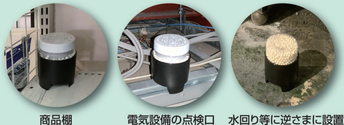
商品棚 電気設備の点検口 水回り等に逆さまに設置