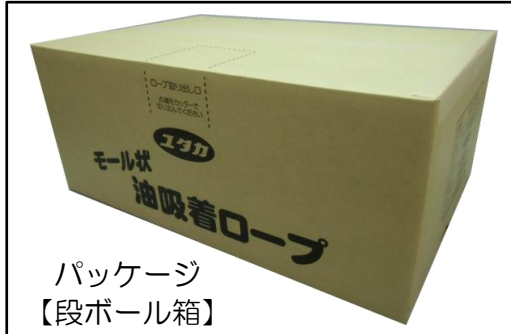
パッケージ 【段ボール箱】