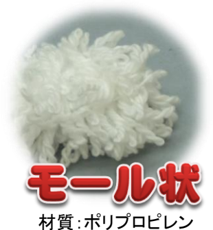
モール状 材質:ポリプロピレン