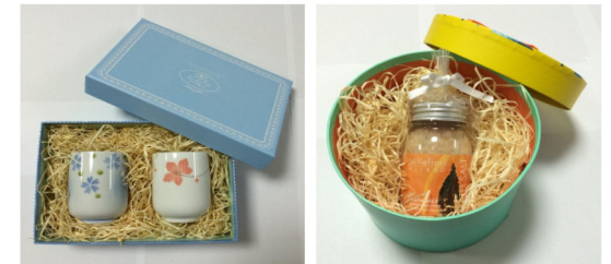
■陶器類の緩衝材、贈り物のラッピングに